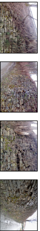
RILEVO FOTOGRAFICO AREA DI INTERVENTO